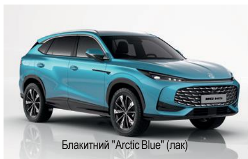
Блакитний "Arctic Blue" (лак)