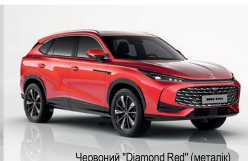
Червоний "Diamond Red" (металік)