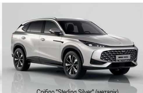
Срібло "Sterling Silver" (металік)