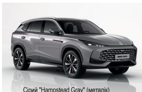
Сірий "Hampstead Gray" (металік)