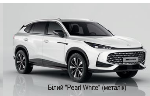
Білий "Pearl White" (металік)